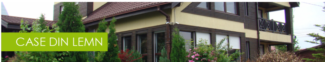
CASA BIANCA 206 P+M