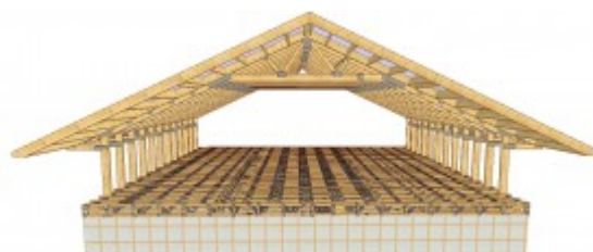
Proiectare mansarda, mansarde tip arcuit