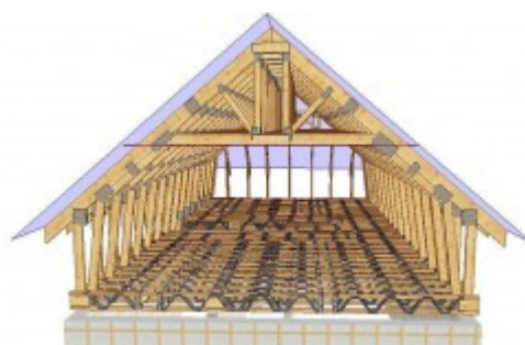
Proiectare mansarda. mansarde cu suprainaltare pereti