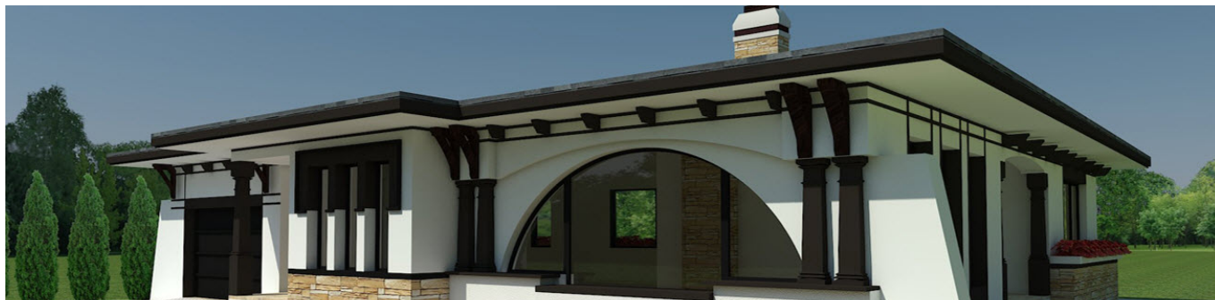
Randare Arh. Georgescu Gabriel-Executie-Casa Lemn BIANCA