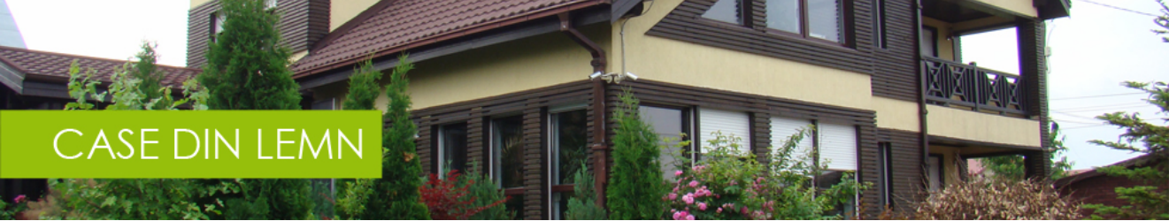
CASA BIANCA 130 P+M