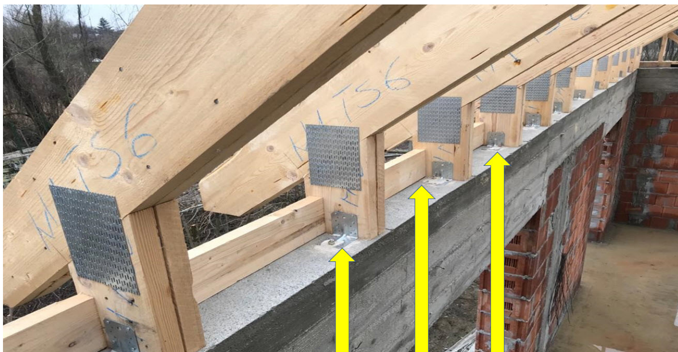
Fixarea sarpantei, ancora chimica 12x200 mm

Toate organele de asamblare utilizate sunt agrementate CE detinand certificate de performanta!