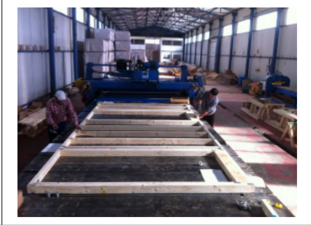
2. Placi multicii pentru ferme din lemn