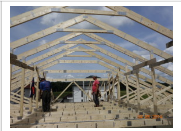
3. Placi multicii Posi Strut pentru planseu (inlocuieste placa de beton).